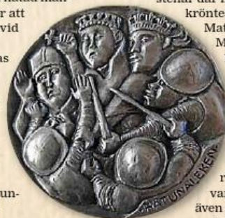
Fransidan av Birger Magnussons kungamedalj visar Hátunaleken 1306.

N en det fanns ju en Magnus kvar, han som satt fängslad i Stockholm och var den flyende Birgers son. Han som själv hade blivit utsedd till tronarvinge efter sin far 1304 just vid Mora stenar, men som nu förvandlats till en parentes i den svenska regentlängden.