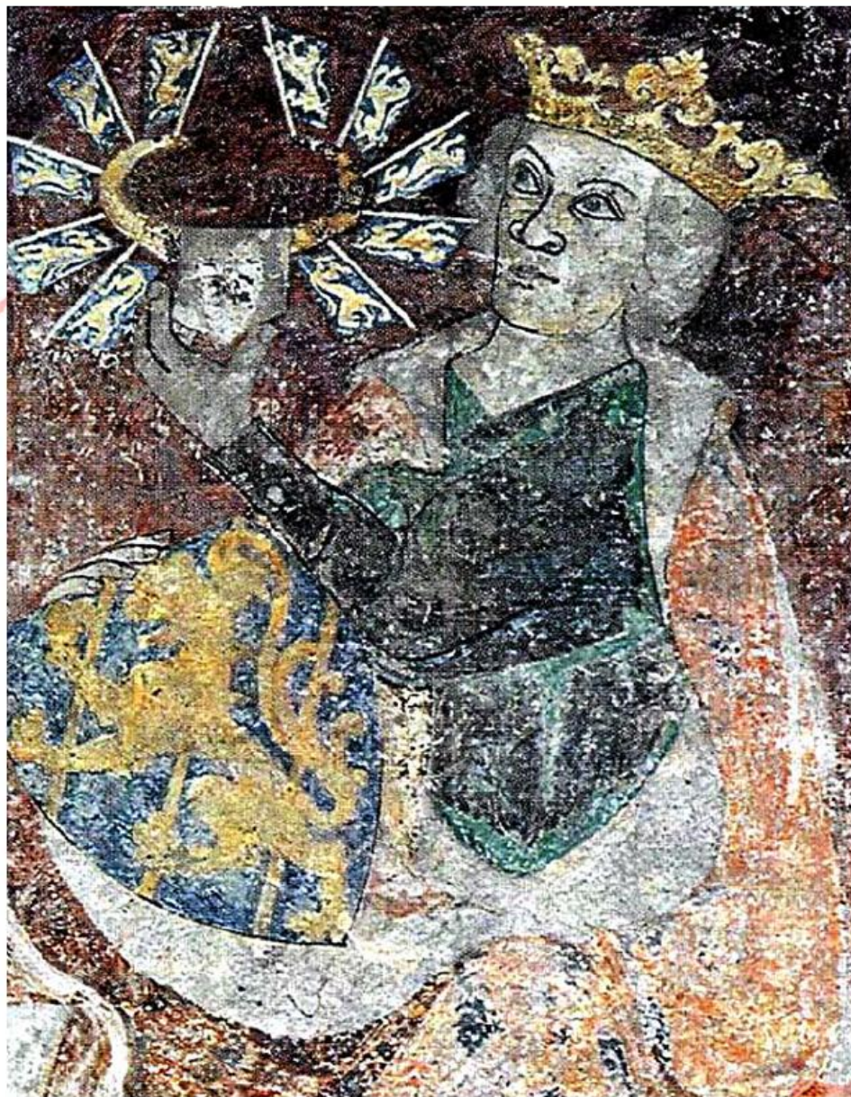
Porträtt av kung Birger i Sankt Bendts Kirke i Ringsted där han är begravd.