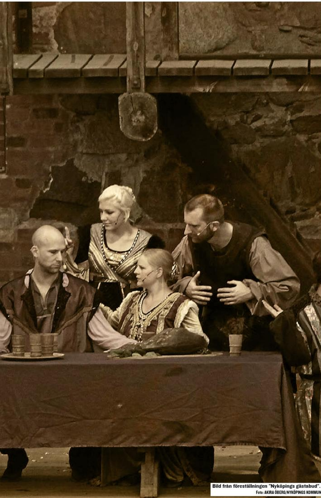
Bild från föreställningen "Nyköpings gästabud".

■ ■ Svek, hämnd och mord. I Sveriges eget "Game of Thrones" kämpar bröder om sin fars kungliga tron – och den historiska verkligheten överträffar tv-dikten.