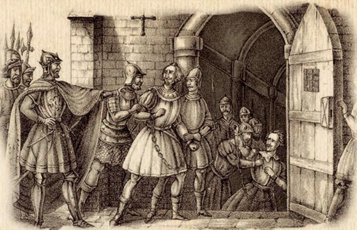
I december 1317 bjöd kung Birger sina bröder Erik och Valdemar på fest i Nyköpingshus. Sedan firades de ner i en djup fängelsehåla där de fick svälta ihjäl.

Magnus sades vara en hederlig ung man och lät sig själv överlämnas till fienden för att dessa skulle skona hans vänners liv. Till och med upprorsbrödernas nu styrande män med Mats Kettilmundsson i spetsen insåg att det inte var Magnus fel att han var son till den i deras ögon svekfulle Birger.