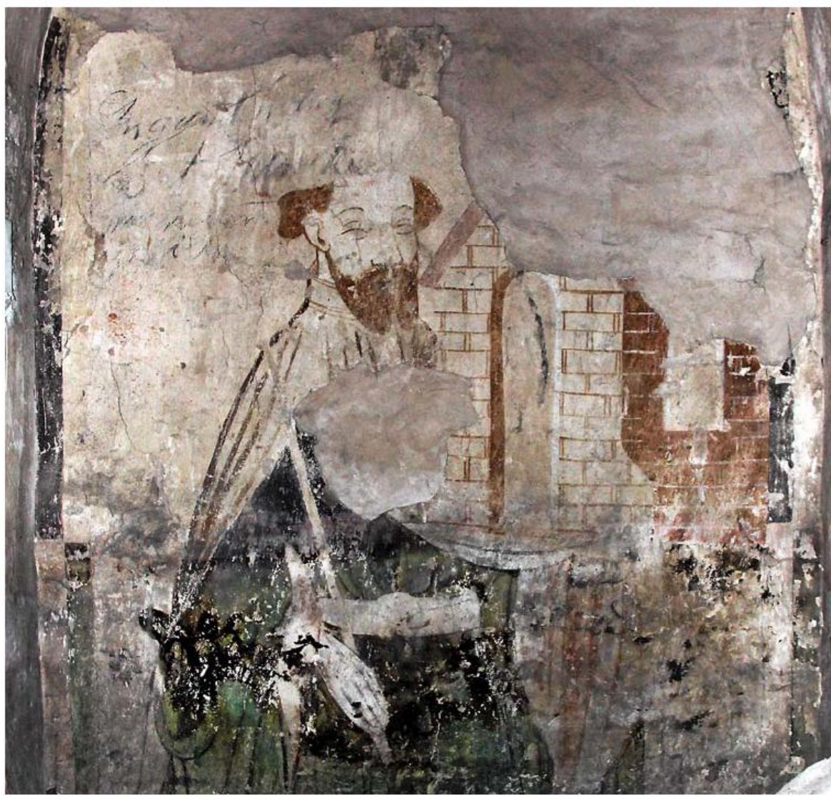
Medeltida väggmålning från 1400-talet föreställande kung Magnus Ladulås i Ridderholmskyrkan, Stockholm.