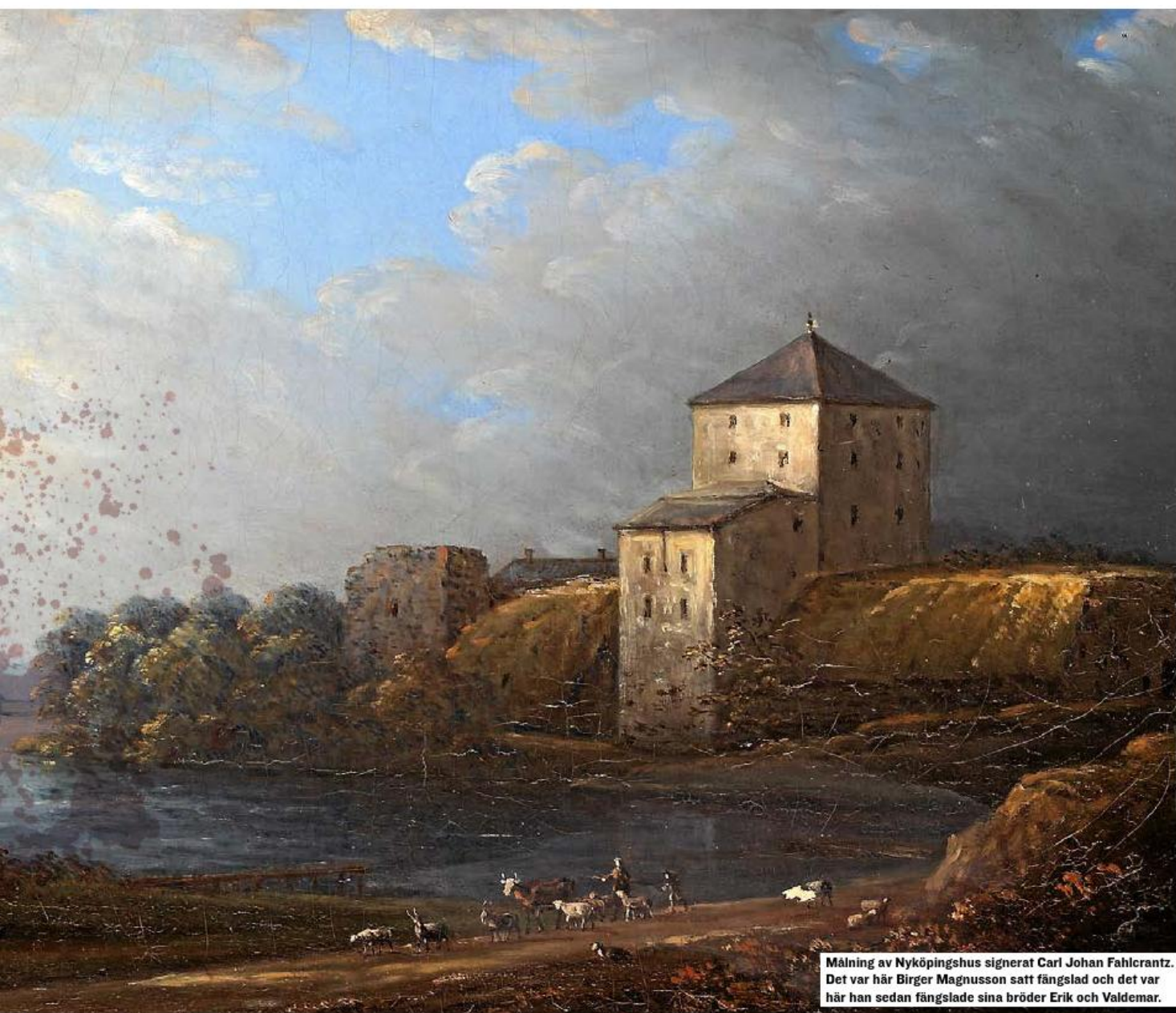
Målning av Nyköpingshus signerat Carl Johan Fahlcrantz. Det var här Birger Magnusson satt fängslad och det var här han sedan fängslade sina bröder Erik och Valdemar.