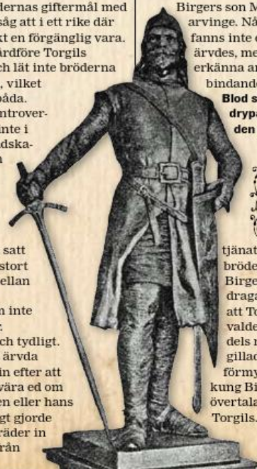
Torgils Knutsson, staty i Viborg.

Mitten stod nu Torgils, marsken som tjänat på striden mellan bröderna genom att vara Birgers lojale vapen- dragare. Sluge Erik insåg att Torgils måste bort och valde att spela ut marsken dels mot kyrkan som inte gillade Torgils sedan förmyndartiden, dels mot kung Birger som nu skulle övertalas att ta sin hand från Torgils.