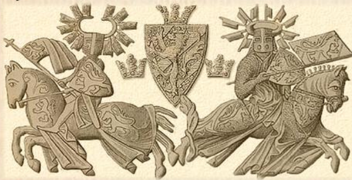
Hertigarna Erik och Valdemars respektive sigill med fadern Magnus vapen i mitten.

Små traditioner från vikingatiden innebar att man "drack jul" tillsammans. Fastän Sverige kristnats fanns traditionen kvar långt senare. Det var under ett