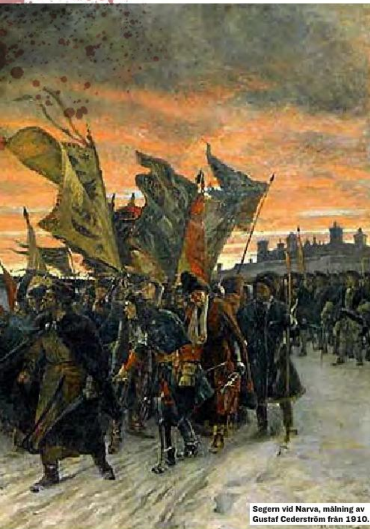
Segern vid Narva, målning av Gustaf Cederström från 1910.

soldaterna gått ombord på fartygen seglade de över det stormiga Östersjön och nådde Pärnu i Estland.