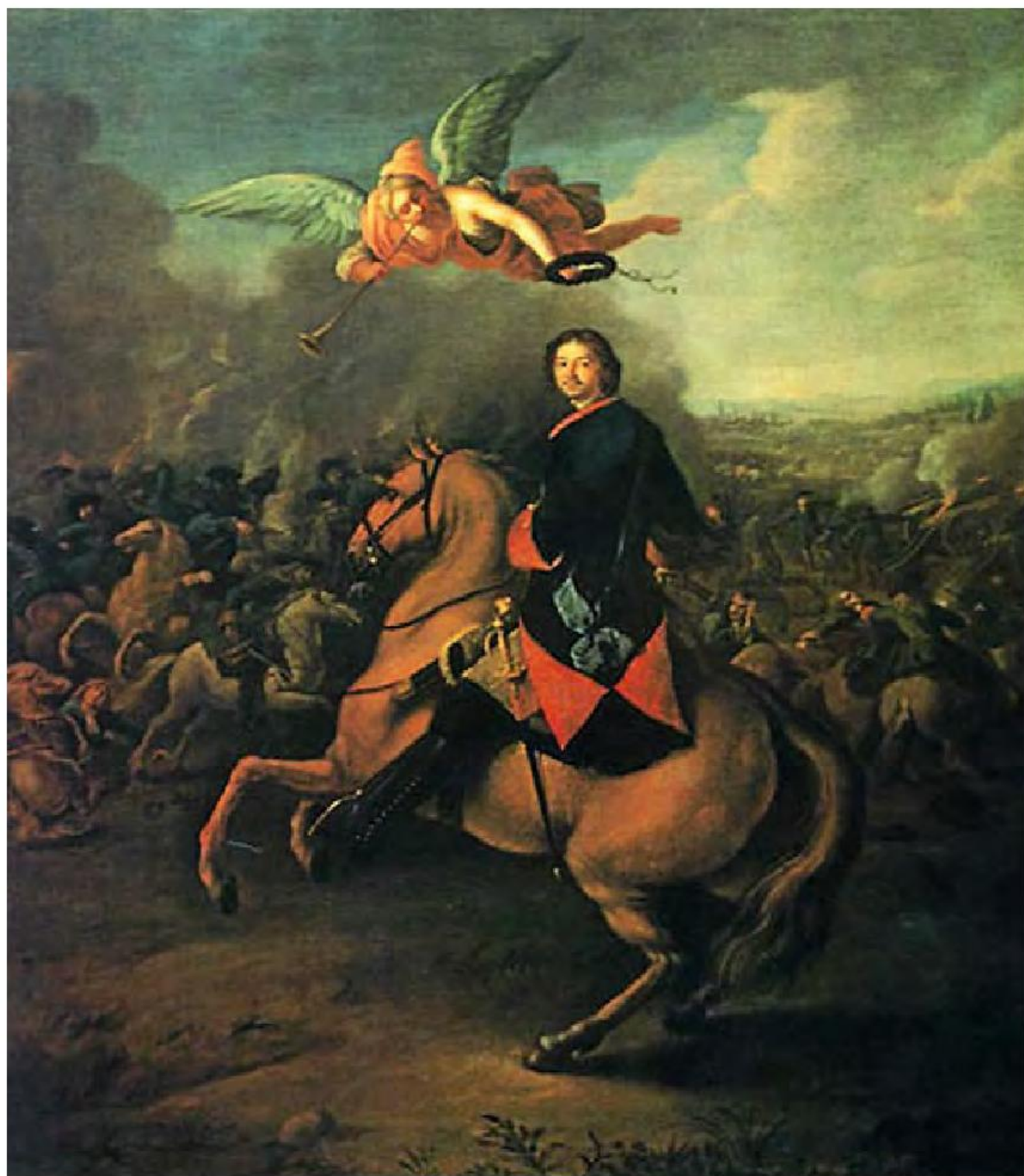
Peter den store under slaget vid Poltava, målning av Johann Gottfried Tannauer.