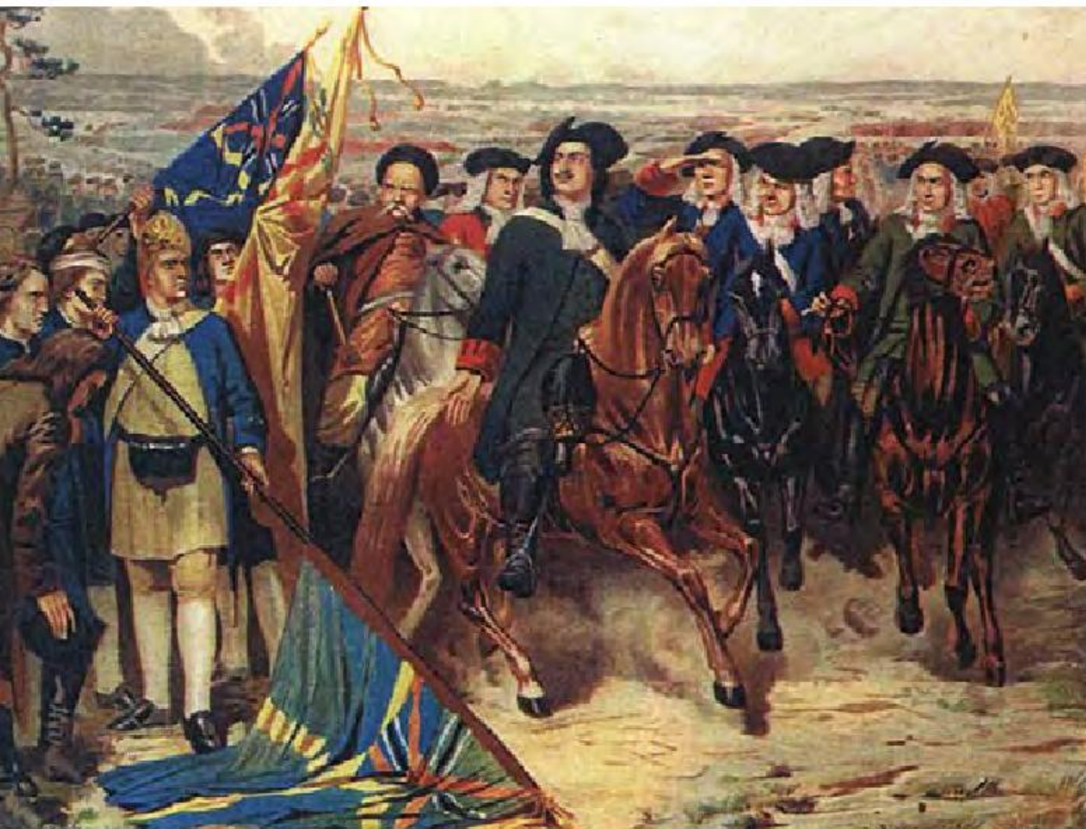
Den svenska armén kapitulerar under slaget vid Poltava. Målning av Aleksey Danilovitch Kivshenko från 1887.