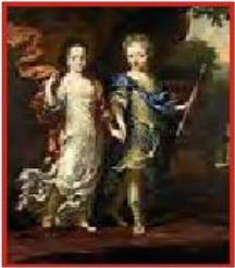
Karl XII och Hedvig Sofia, Karls ena syster.

1682 17 juni: Karl XII föds på Slottet i Stockholm. Samma år skapar fadern Karl XI indelningsverket som formar den svenska armén.