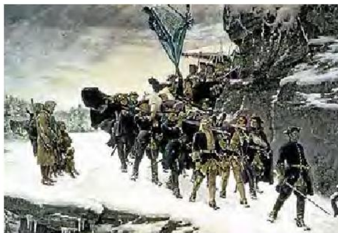
"Karl XII:s likfärd", målning av Gustaf Cederström från 1884.

S ill en början gick allt enligt planen när svenskarna tassade så tyst de kunde mot försvarsskansarna. Men förvirringen och irritationen hos de svenska ledarna hade sinkat trupperna och nu bröt också solen genom mörkret.