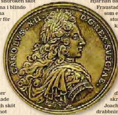
Medalj slagen till äminnelse av slaget vid Narva.

Striderna kom att stå vid Kliszó i södra Polen och senare Fraustadt. Återigen skulle en numerärt underlägsen svensk armé krossa sina motståndare.