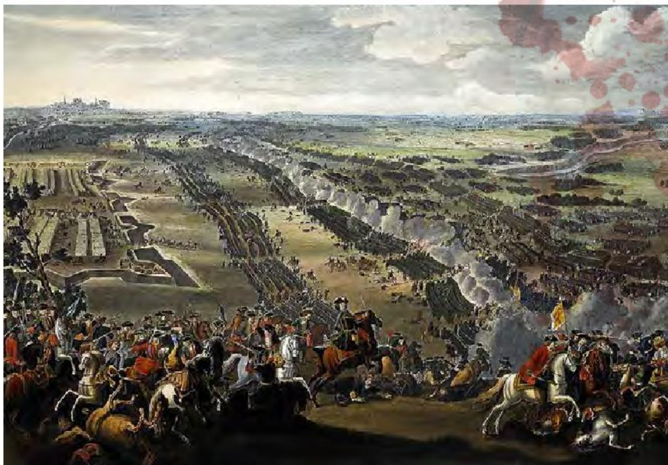
Slaget vid Poltavas slutskede. Målning av Pierre-Denis Martin, på uppdrag av Peter den store. Från 1726.